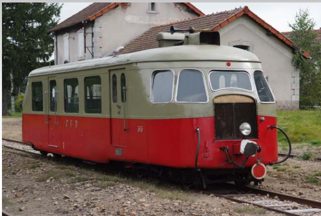
Photo : Le Billard 313 entièrement restauré par le Velay Express - Coll. D. Buraud

Vous pourrez admirer, faire connaissance et, emprunter un autorail Billard A 80D sur les lignes des réseaux : Velay Express et Train de l'Ardèche.