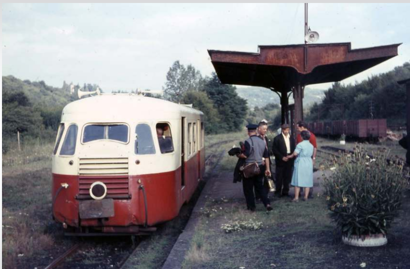
Photo : Belle ambiance à St Bonnet Avalouze avec un Billard à caisse étroite à quai Coll. REE-Modeles

Par la suite, leur modernité et leur robustesse les enverra, au gré des fermetures de réseaux sur le Vivarais, le P.O.C., le Blanc-Argent, la Corse, le Tarn, le Pas-de-Calais, et les tramways de la Corrèze.