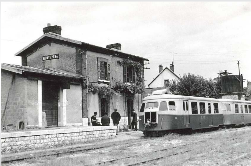
Le Billard 801 en gare de Montreau

Dans l'entre-deux guerres, l'autorail a prouvé ses qualités techniques et économiques et permis la sauvegarde de nombreuses lignes secondaires à voie métrique, en France. C'est dans ce contexte, économiquement bouleversé, toujours en recherche de rentabilité, que les compagnies exploitantes dont les C.F.D., demandent aux constructeurs français de se pencher sur l'étude d'engins exploitables avec un nombre restreint d'agents, facilement utilisables sur des lignes en antennes ou sur des distances assez courtes. La concurrence routière est féroce, il faut gagner en vitesse commerciale et coût d'exploitation kilométrique.