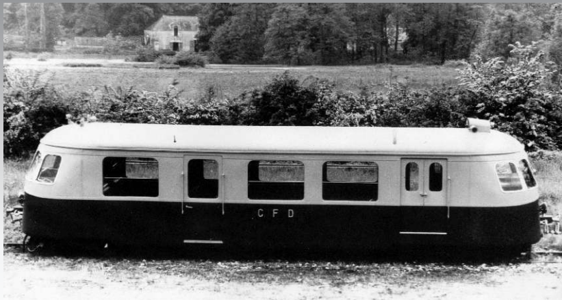
Photo : Un A80D CFD en version d'origine