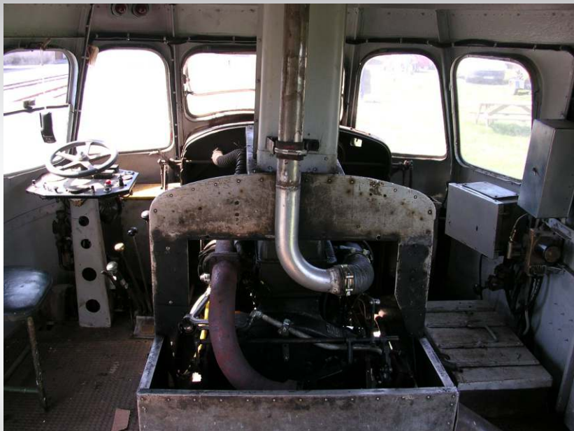
Photo : Cabine de conduite et moteur d'un A80D

La caisse, légère, comprend deux, voire trois compartiments : un pour le moteur et les bagages (ou un pour chaque attribution sur les modèles plus longs), un pour les voyageurs, dans lequel est aménagée, sur la gauche dans le sens de la marche, une loge pour le conducteur. Le confort des voyageurs est assuré par des dispositions techniques propre à Billard : le moteur est installé directement sur le bogie, pas de transmission des vibrations vers la caisse. Les suspensions combinent ressorts à lames et à boudins.