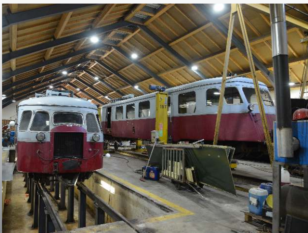
Photo : Le Billard 316 des CFV dans le superbe atelier d'entretien de la compagnie.