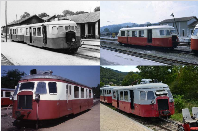
Photos : 4 A80D, tous différents.

REE-Modeles reproduit les versions à caisses larges en respectant les particularités d'époque et propre à chacun des numéros.