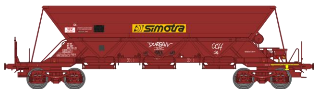
W-012-F-03 N°33 87 690 1 910-7 «SIMOTRA» EX T2