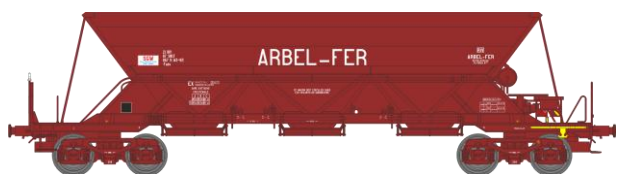
W-012-B-01 N° 21 87 067 9 143-9 «ARBEL FER» EX T2