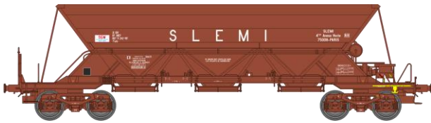
Réf. WB-307 – TREMIE EX T2 Ep.IV

W-012-E-01 N° 33 87 6900 074-0 «ROY COLAS RAIL»