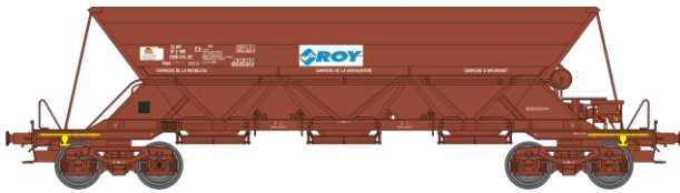
Réf. WB-306 – TREMIE EX T1 Ep.V

W-012-D-06 N° 33 87 690 0 041-9 feux fin de convoi «ROY»