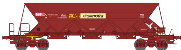
W-012-C-05 N°33 87 690 1 138-2 «SIMOTRA» EX T3