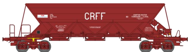
W-012-C-03 N° 21 87 067 8 746-0 «CRFF» EX T3