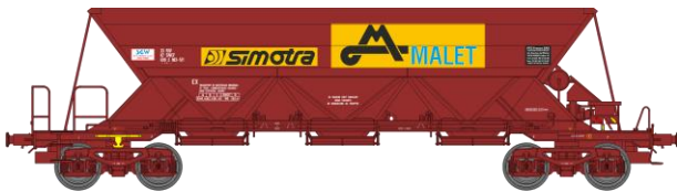
Réf. WB-308 – TREMIE EX T3 Ep.V

W-012-F-01 N° 21 87 067 9 242-9 «S L E M I»