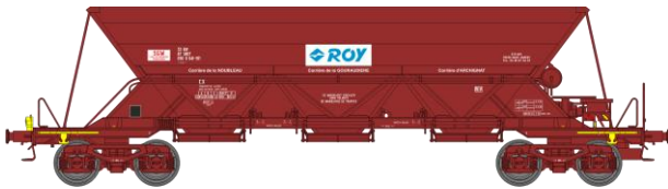
Réf. WB-305 – TREMIE EX T1 Ep.IV-V

W-012-H-01 N° 21 87 067 8 932-5 feux fin de convoi «DENAIN NORD-EST LONGWY»