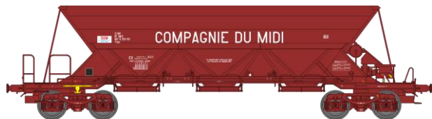
W-012-C-02 N° 21 87 067 8 353-5 «COMPAGNIE DU MIDI» EX T3