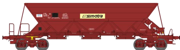
W-012-C-04 N°33 87 690 1 763-7 «SIMOTRA » EX T3