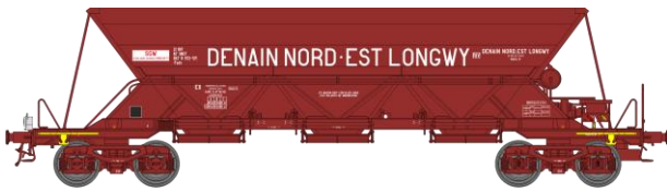
Réf. WB-304 – TREMIE EX T1 Ep.IV

W-012-H-01 N° 21 87 067 8 932-5 feux fin de convoi «DENAIN NORD-EST LONGWY»